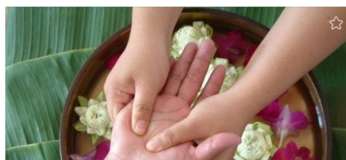
Травматизм. Причины, профилактика, первая помощь. — Школа здоровья — ГБУЗ Городская поликлиника 25 г. К krdgp25.ru